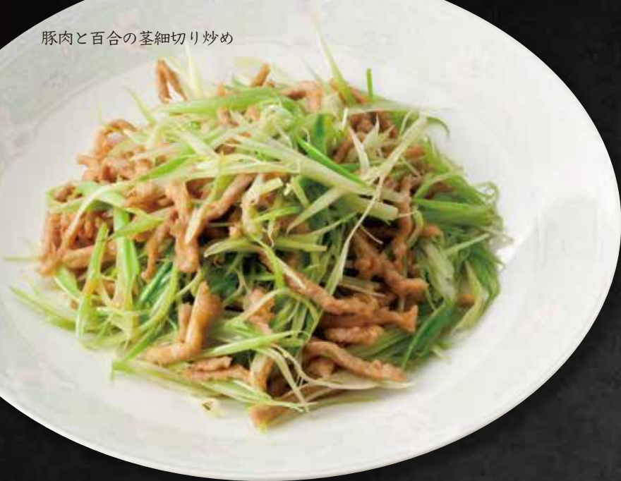
豚肉と百合の茎細切り炒め